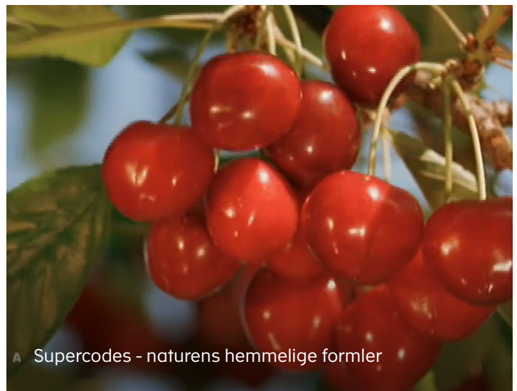
▲ Supercodes - naturens hemmelige formler